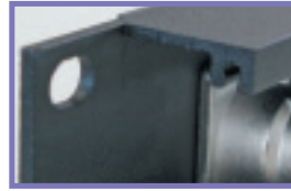
Perfil Panel muy robusto Strong panel frame