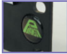
Logotipo incrustado Inserted logotip